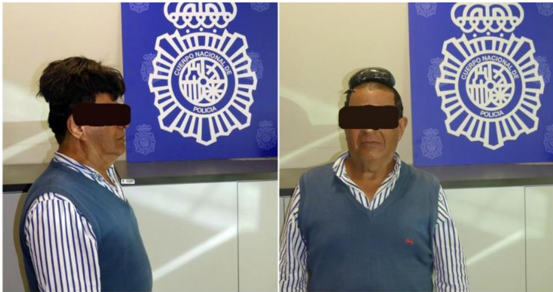
El hombre detenido venía de Bogotá (Colombia) e intentaba aparentar ser un turista más